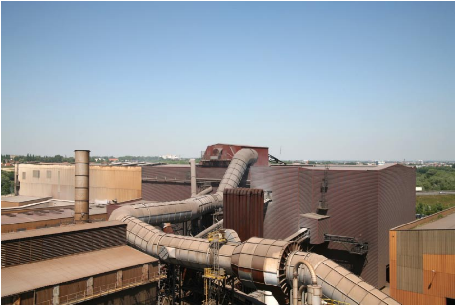
EE 11 / 2010, tirage Lambda couleur, 108,5 x 148,5 cm.

Résidence de recherche et de création du CRP