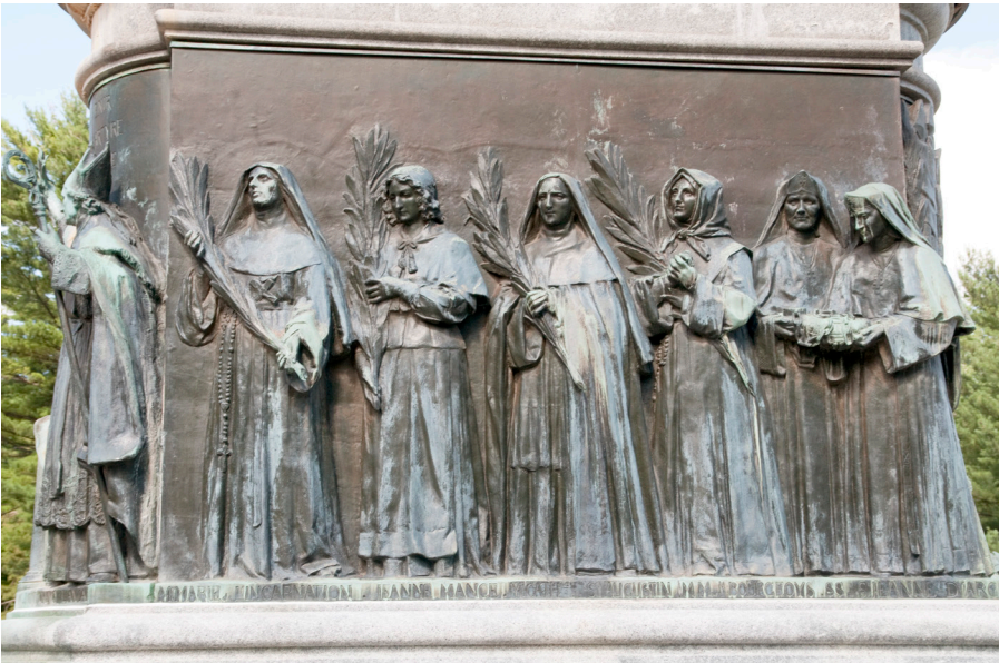
Hauts reliefs du monument de Jeanne d'Arc qui évoquent les grandes figures de l'histoire de la Nouvelle-France.