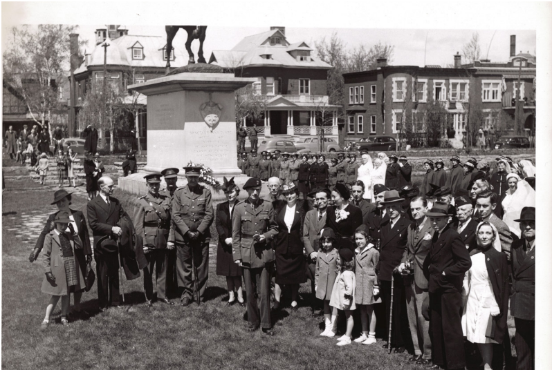
Comité de la France libre de Québec réuni devant le monument de Jeanne d'Arc en mai 1942.

La Jeanne d'Arc des Plaines d'Abraham n'est pas devenue un symbole pour les nationalistes ou les séparatistes québécois, mais, pendant la Seconde Guerre mondiale, le site fut un lieu de rassemblement pour le comité de la France libre de Québec. En juillet 1997, un monument à Charles de Gaulle fut installé à proximité pour marquer le 30 e anniversaire de son voyage historique au Québec. Ce monument a également été l'objet de nombreuses réserves et polémiques lors de son inauguration. Situé entre la statue de Jeanne d'Arc et celle de Montcalm, le général de Gaulle créait un axe symbolique perturbant pour certains esprits 103 .