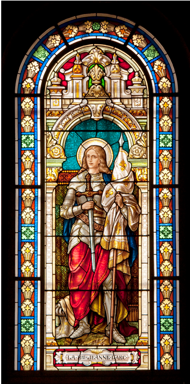
Vitrail dédié à Jeanne d'Arc à l'église Saint-Charles de Limoilou à Québec, réalisé en 1918 par la Maison Bernard Leonard.