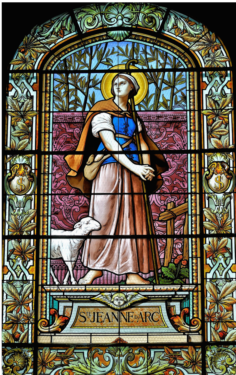
Vitrail dédié à Jeanne d'Arc tel que réalisé pour la cathédrale Notre-Dame de Québec.