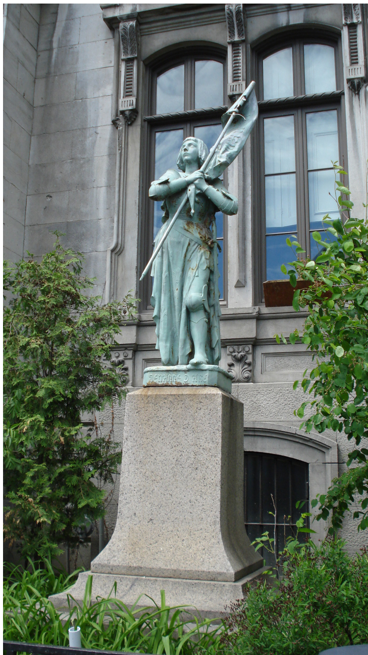
Statue de Jeanne d'Arc, par André-César Vermare, devant le siège de l'Union française à Montréal..