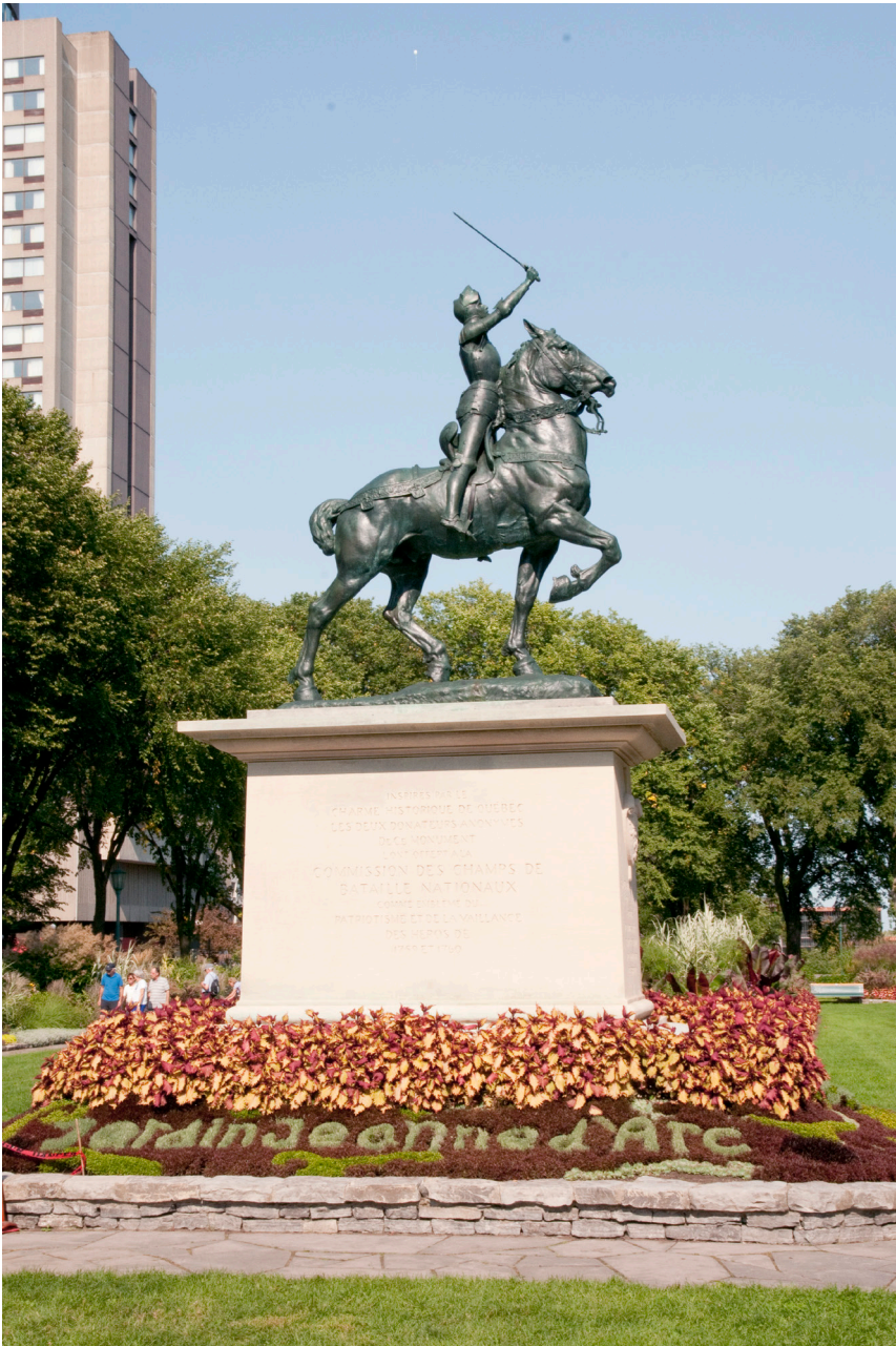
Monument de Jeanne d'Arc, offert en 1938 par les époux Huntington, installé dans un jardin à la française situé à l'entrée du Parc des champs de batailles à Québec.