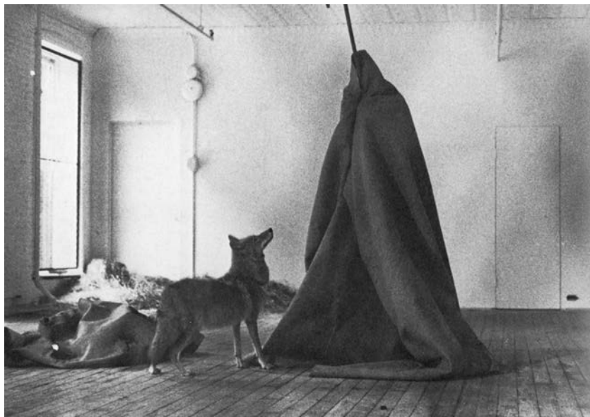
> Joseph Beuys, I Like America, America Likes Me , 1974.