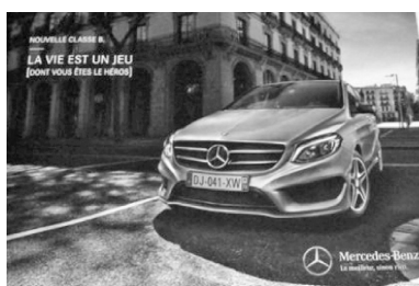
Campagne Mercedes (Classe B) 2015 La vie est un jeu (dont vous êtes le héros)