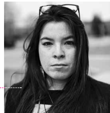
Natasha Kanapé Fontaine