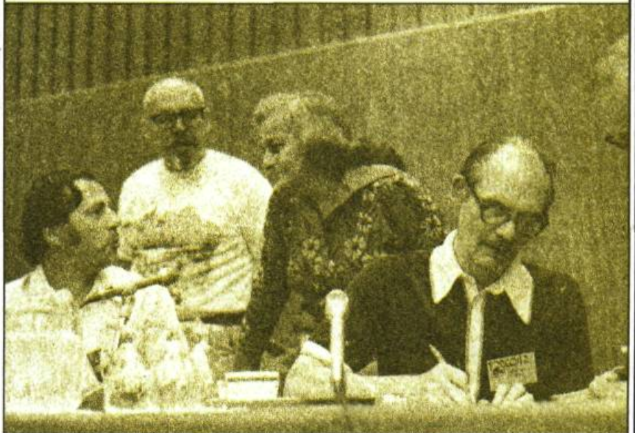
photo du bas de gauche à droite: Isaac Asimov, Roger Zelazny et Hal Clément

photo du haut de gauche à droite: Ben Bova, Harry Harrison, Judith Merrill et Frederik Pole