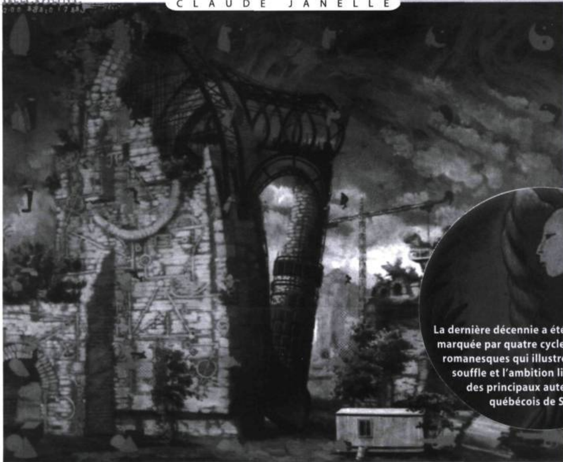
Illustration de Michel Boulanger, couverture de Récits de Médilhaut d'Anne Legault. En médaillon, détail de « Le Velleur » de Pierrette Lambert, couverture de Corps-machines et rêves d'anges d'Alain Bergeron.

La dernière décennie a été marquée par quatre cycles romanesques qui illustrent le souffle et l'ambition littéraires des principaux auteurs québécois de SF.