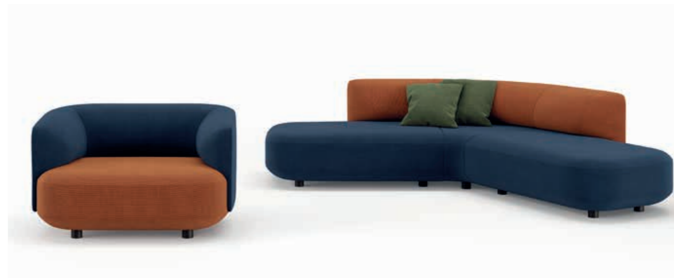
Steelcut Trio 3 SYBB, SYMA - Cuscini | Cushions | Coussins: Steelcut Trio 3 SYVM