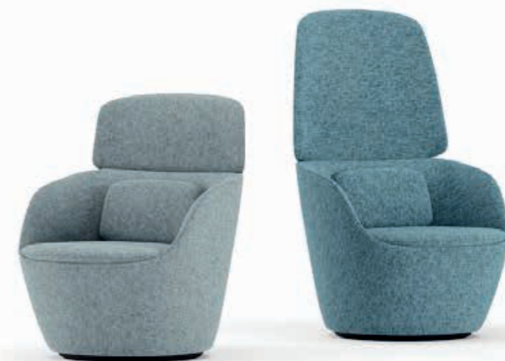
Rivet T7B1, T7G1