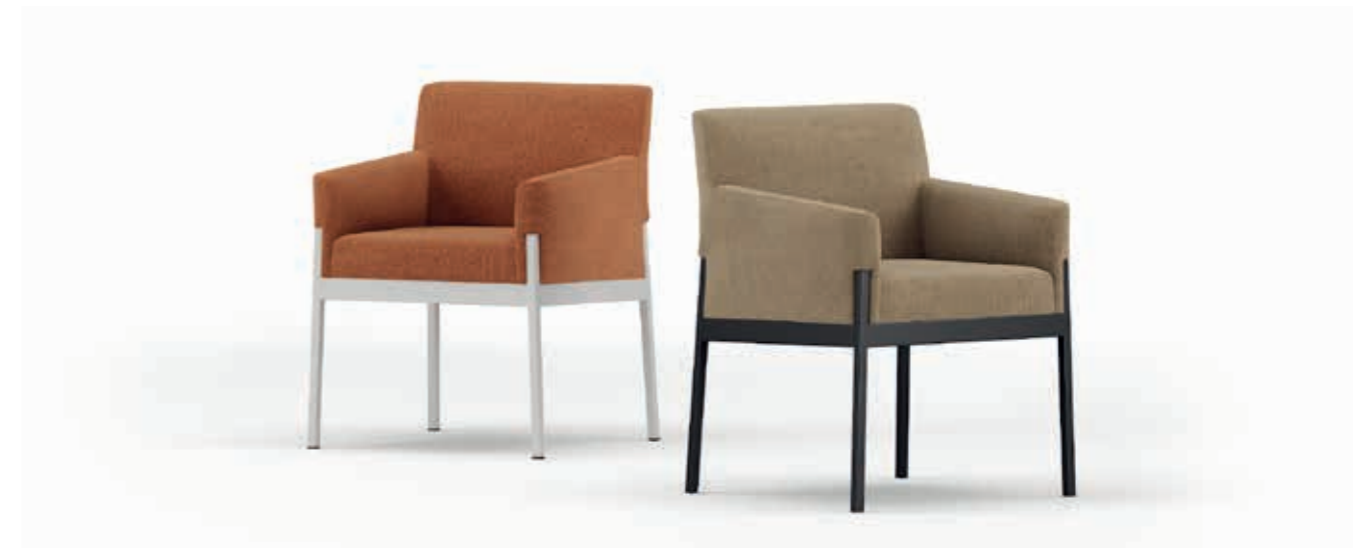
Focus R9M4, R9M8