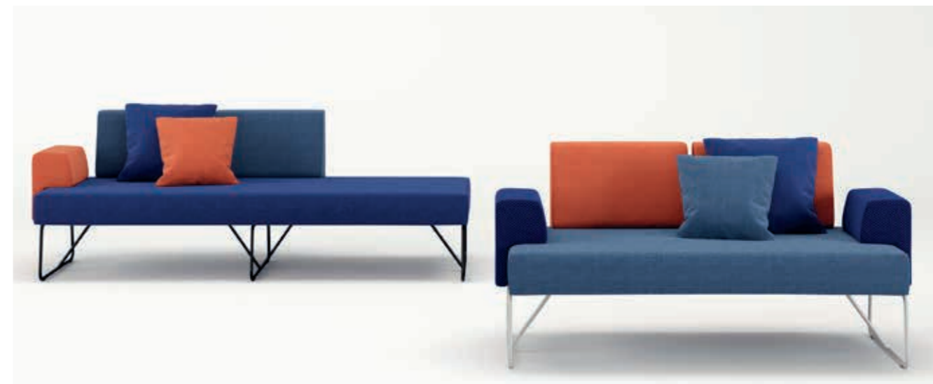
Oceanic S2B3, S2B2, S2R2 - Cuscini | Cushions | Coussins: Oceanic S2B3, S2B2, S2R2