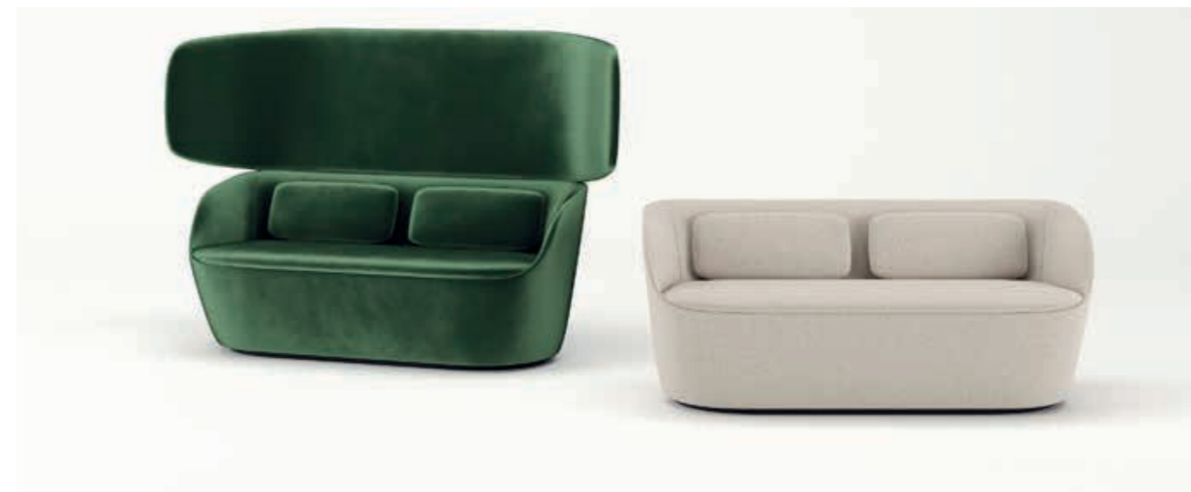
Ombra S5V0; Ecriture S4M0 - Cuscini | Cushions | Coussins: Ombra S5V0; Ecriture S4V1