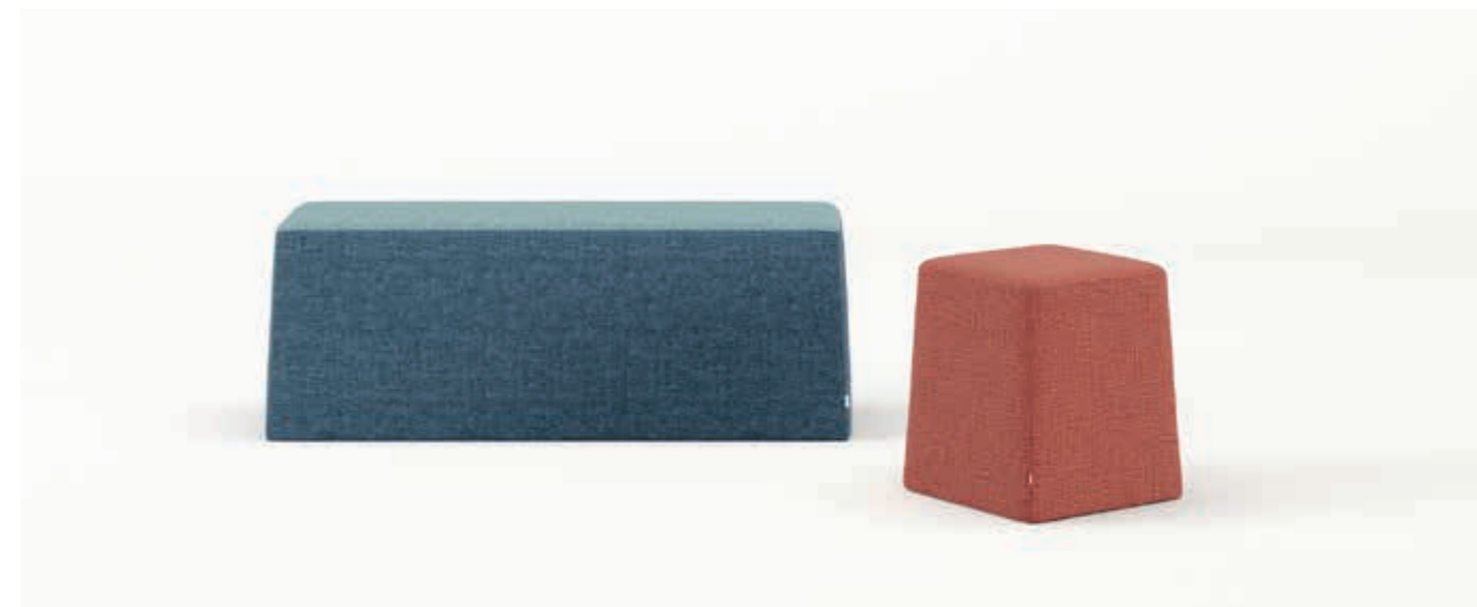
Time S6B0, S6B4, S6R1, S6R6