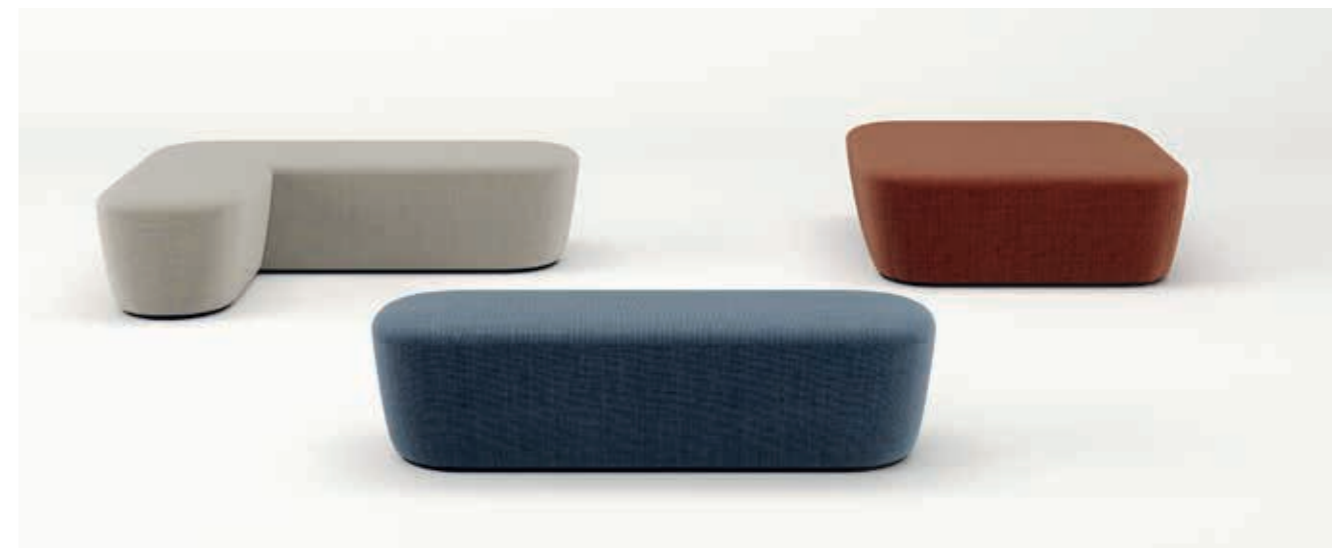
Remix 3: RIH2, RIA4, RIO1