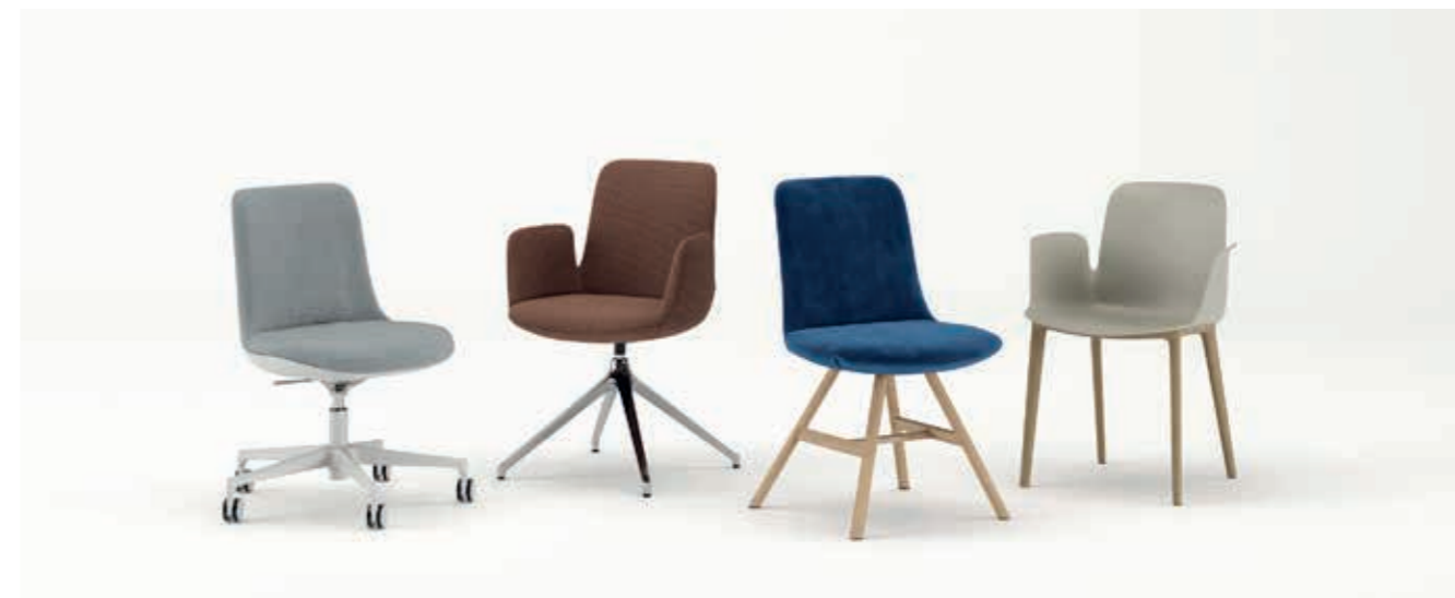
Rondo S0M0, Ombra S5B1, Polipropilene | Polypropylene | Polypropylène L1M1