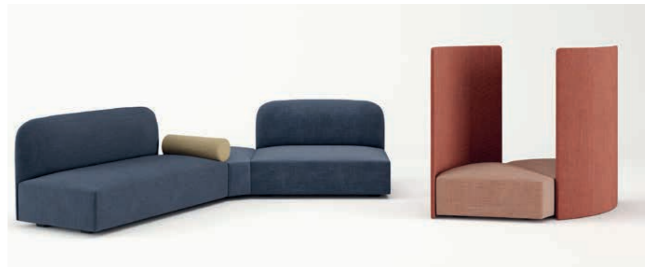
Ecriture S4V0, S4V1, S4B1