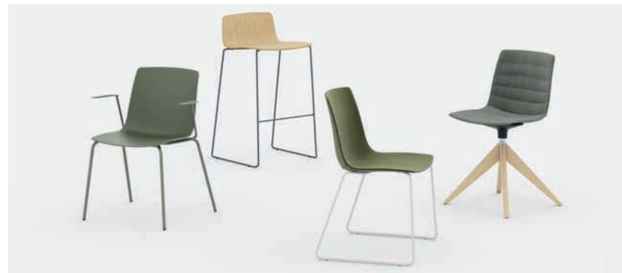
Polipropilene | Polypropylene | Polypropylène L4G5, Remix 3 R1R2, Rovere naturale | Natural oak | Chêne naturel