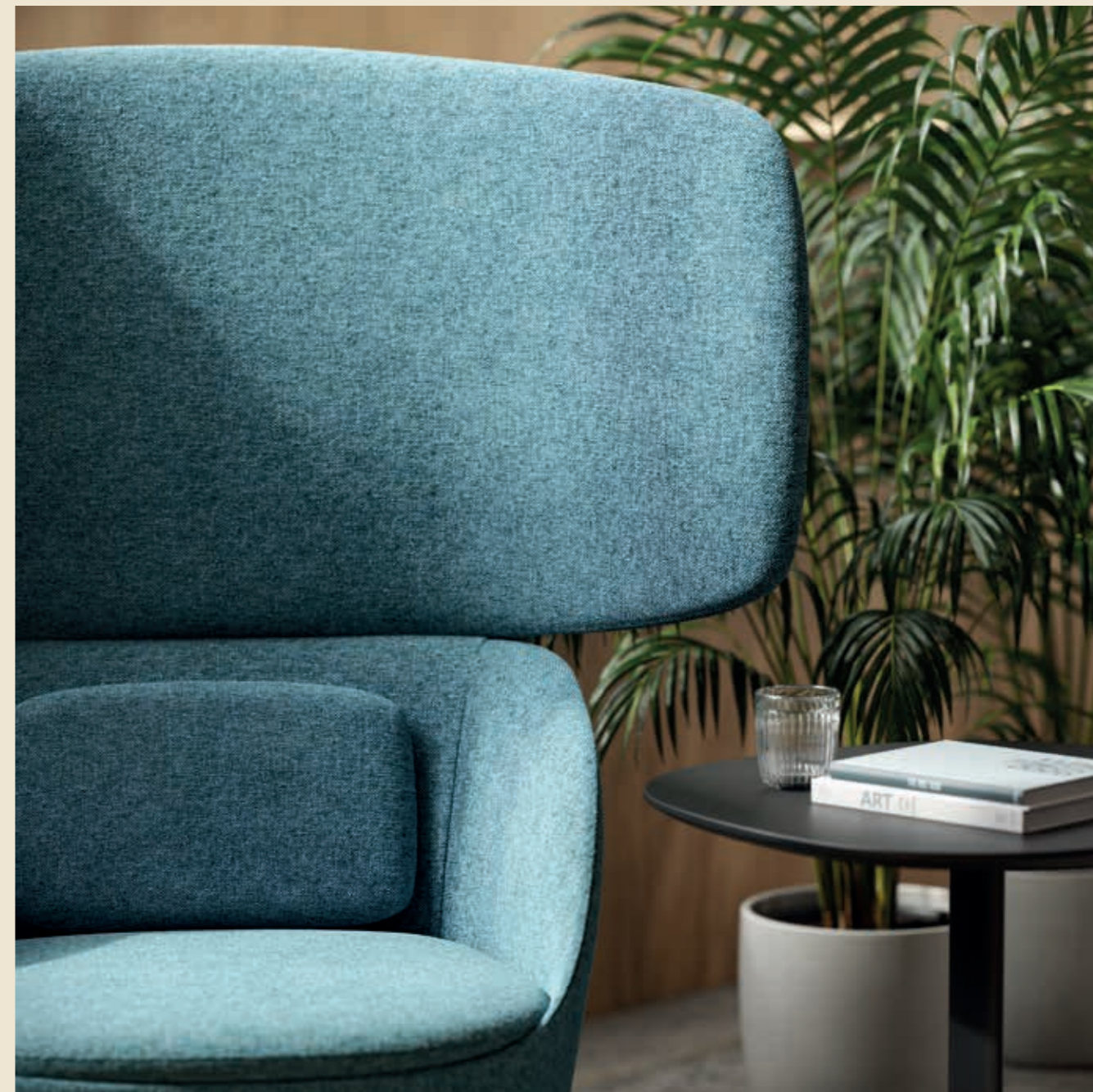
Radar Extra Large Poltrona Extra Large rivestita in tessuto Rivet T7B1.