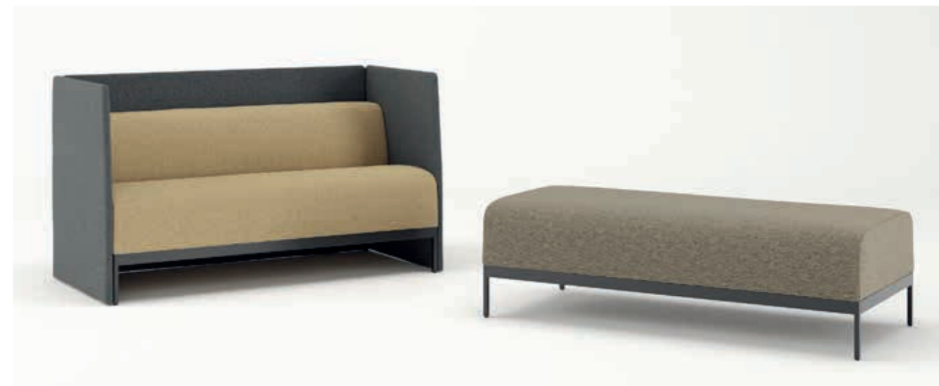
Ecriture S4G2, S4V1, S4V0