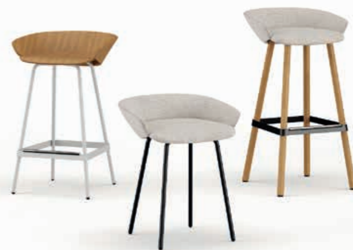
Rovere naturale | Natural oak | Chêne naturel; Chili SOG6