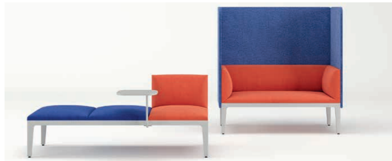
Era T8BB, T8BA, T8R9