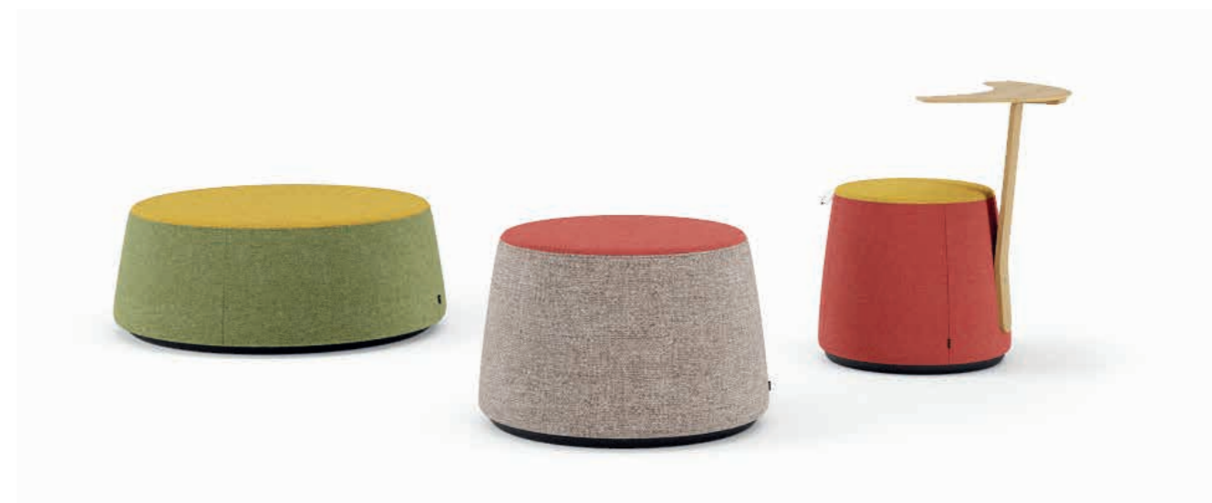
Time S6R3, S6V0, S6G0, S6V3