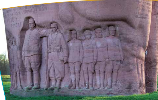
Sculpture au pied du monument

2 000 tonnes de béton armé. Au pied du monument, est sculpté le haut-relief des artisans du « Miracle de la Marne » : les deux plus grands (Joffre et le Soldat de la Marne) entourés des généraux. Sur la face nord, au-dessus de ce groupe, le texte intégral du fameux ordre du jour de Joffre, le 6 septembre 1914 (« ...se faire tuer sur place plutôt que de reculer... »). Sur la face sud est exposé l'ordre de bataille exact des grandes unités engagées avec le nom de leur chef. Ce tableau est surmonté par la dédicace suivante : « À tous ceux qui, sur notre terre, du plus lointain des âges, dressèrent la borne contre l'envahisseur ».