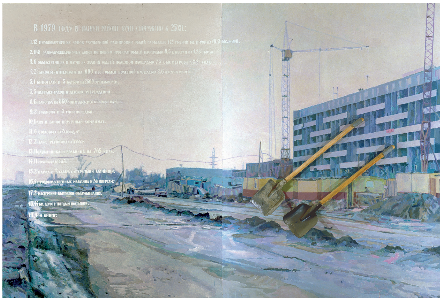
12 Le 25.XII.1979 dans notre district (Le Chantier) (1983). Paris. Musée national d'Art moderne — Centre Georges Pompidou.