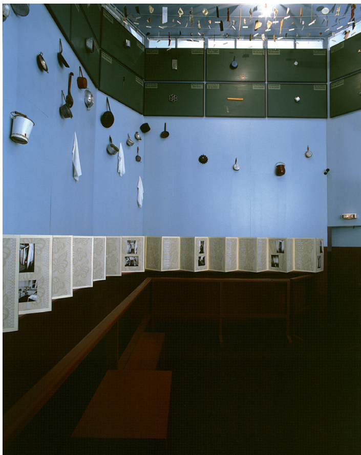
9 La cuisine communautaire (1991). Installation permanente. Paris. Musée Maillol Fondation Dina Vierny (1993).