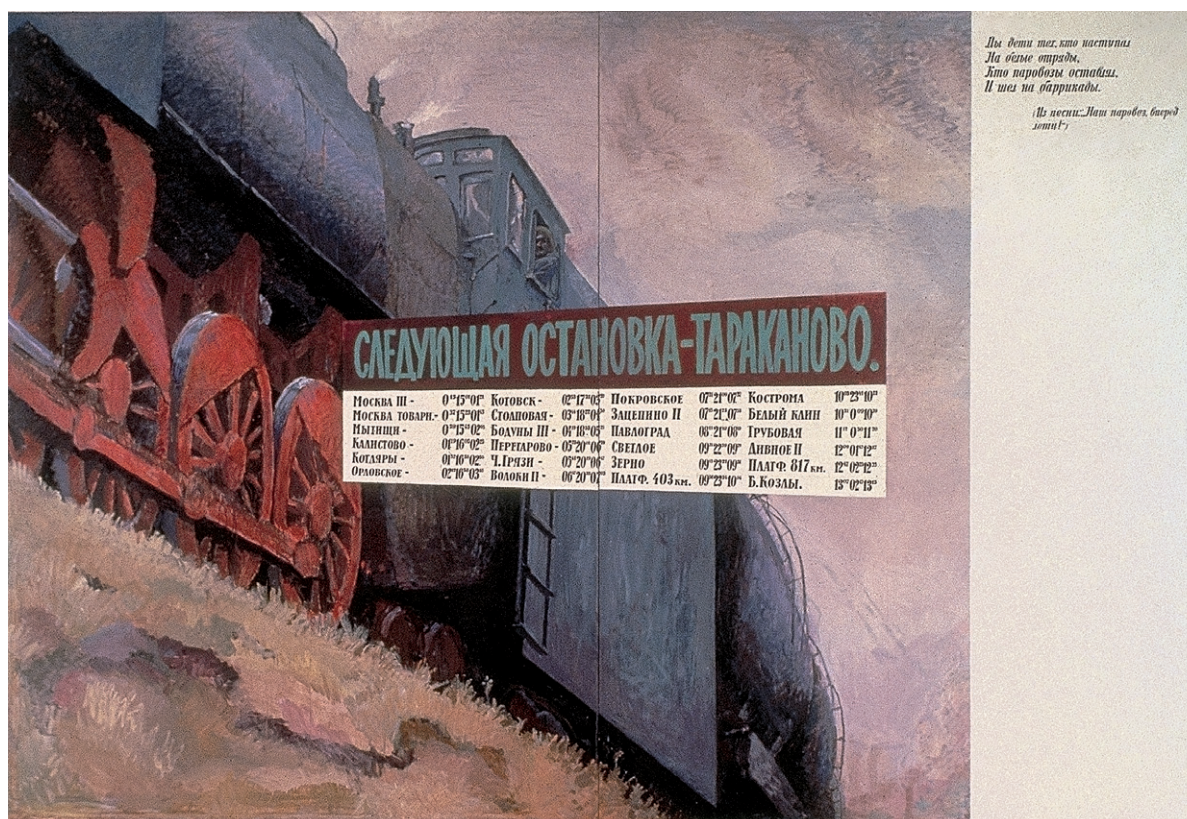
11 Prochain arrêt-Tarakanovo (1979). Bâle. Collection de la Fondation Emmanuel Hoffman.