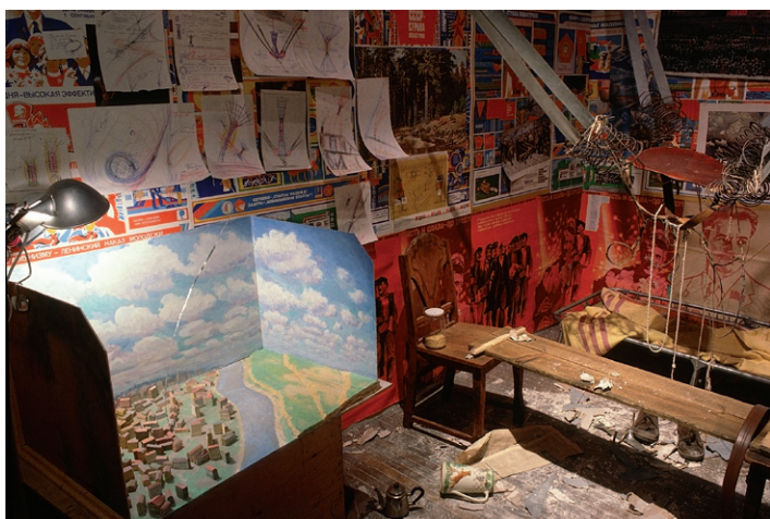
13 14 L'homme qui s'est envolé dans l'espace depuis son appartement (1985). Paris. Musée national d'Art moderne — Centre Georges Pompidou.