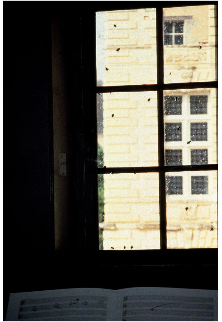
15 16 Concerto pour mouches (1993). Oiron. Château d'Oiron.