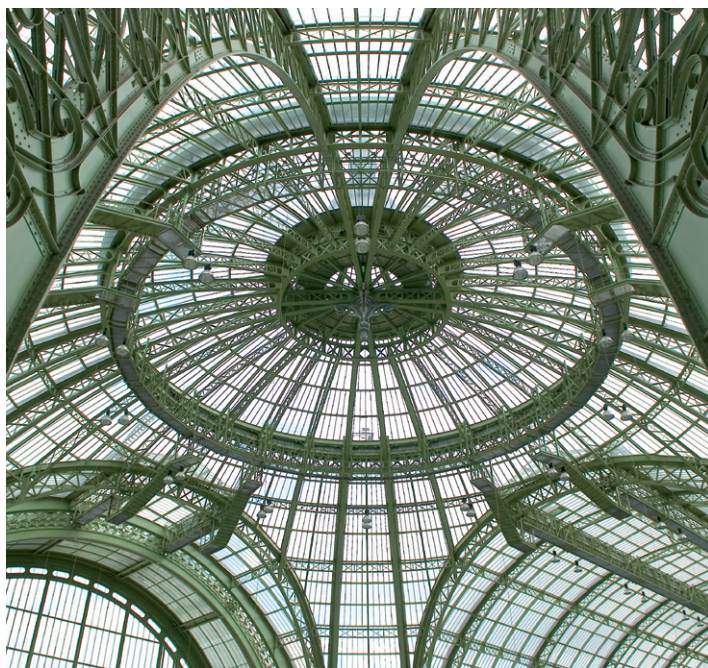
1 Nef du Grand Palais