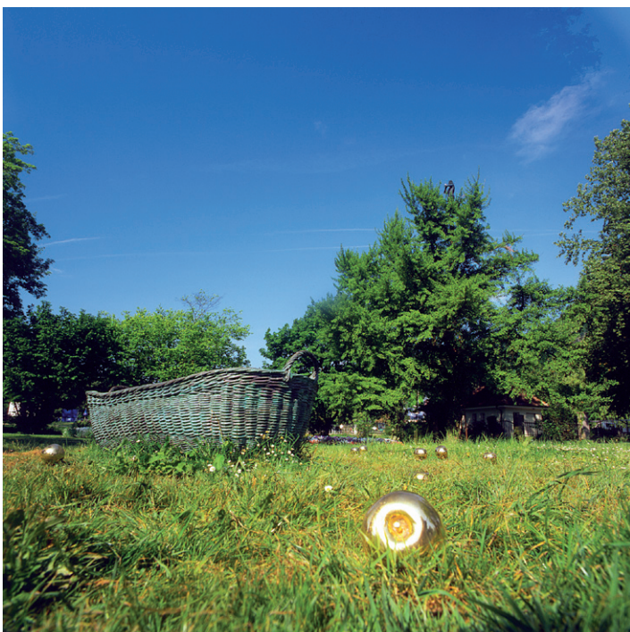
17 18 Les pommes d'or (2000). Singen, Allemagne.