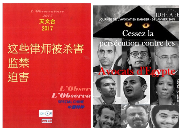
2017 2018 CHINE EGYPTE 60 p. 44 p.