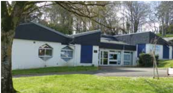
École maternelle - ouverture d'une classe - achat de mobilier, de matériel informatique, installation du WIFI et changement des huisseries 27 000 €