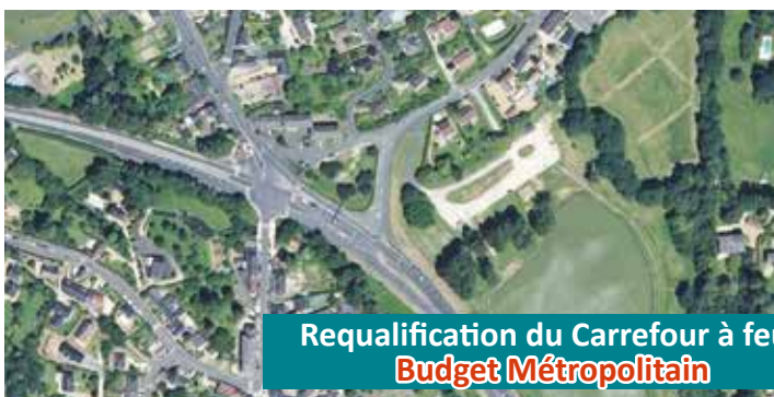
Requalification du Carrefour à feux Budget Métropolitain