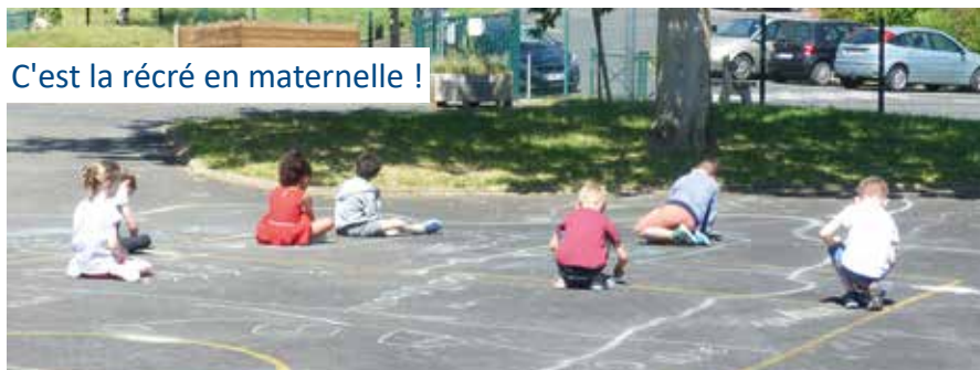
C'est la récré en maternelle !