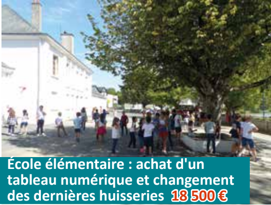
École élémentaire : achat d'un tableau numérique et changement des dernières huisseries 18 500 €

Les dépenses d'investissement inscrites au budget 2020 s'élèvent à 3 930 000 €, vous découvrirez ci-dessous les principaux travaux programmés.