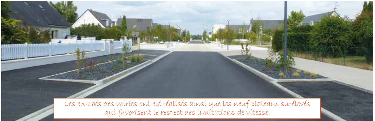
Les enrobés des voiries ont été réalisés ainsi que les neuf plateaux surélevés qui favorisent le respect des limitations de vitesse.