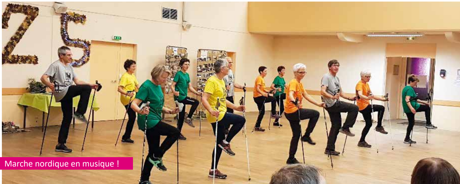
Marche nordique en musique !

Le 14 décembre 2019 restera une date importante pour les Arqueleux. Ils étaient réunis dans une salle Emmanuel Chabier superbement décorée pour fêter les 25 ans du club.