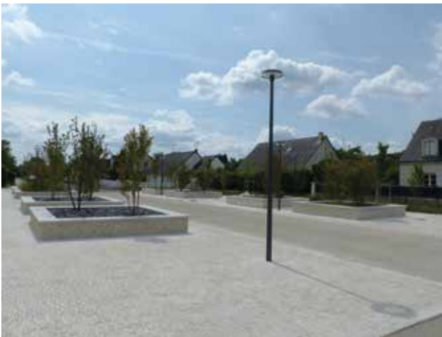
La pose de pavés et la création de massifs mettent en valeur ce nouvel aménagement qui offre aux riverains un cadre de vie de qualité.