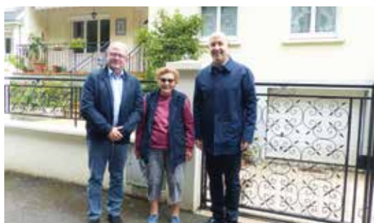
P. 8 | COVID-19, retour sur les actions mises en place

Découvrez votre nouvelle Équipe municipale