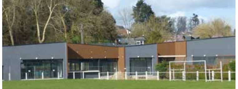
Fin des travaux de la maison des associations - vidéoprotection et mobilier inclus - acquisition d'un pare ballon 1 387 054 €