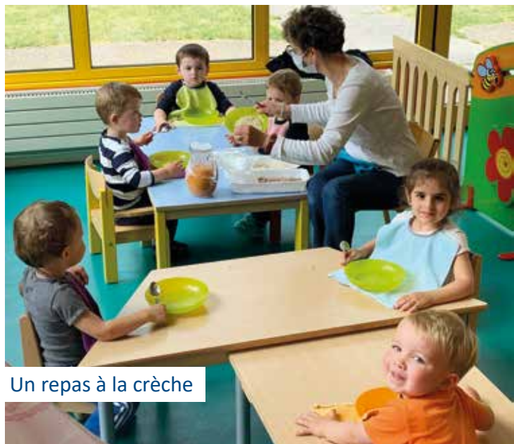
Un repas à la crèche