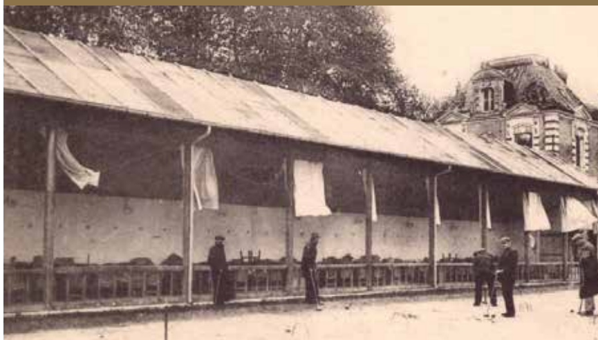
Bel-Air à l'époque du sanatorium

Le souvenir du château de la riche mécène est ravivé lors du centenaire du centre de la Croix-Rouge en 2018. L'événement a réuni la pianiste russe Olga Bobrovnikova, passionnée par Tchaïkovski et traductrice de ses échanges avec sa baronne, et le descendant de celle-ci, Jean-Pierre Rimsky-Korsakoff, en visite avec son épouse pour la deuxième fois à La Membrolle. L'occasion pour lui de présenter lors d'une conférence le lien qui unit son aïeule, Tchaïkovski et La Membrolle.