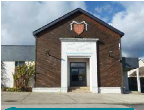
Travaux de rénovation de la salle E. Chabrier 145 000 €