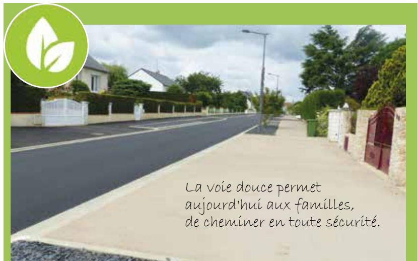
La voie douce permet aujourd'hui aux familles, de cheminer en toute sécurité.