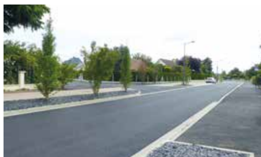
P. 11 | L'avenue Charles de Gaulle fait peau neuve !