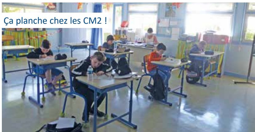
Ça planche chez les CM2 !