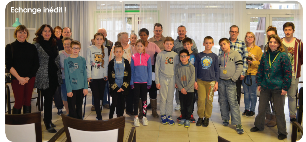
Echange inédit !

Les huit résidents avaient bien un peu le trac, avant de commencer la séance. Mais, à l'arrivée des enfants, leurs regards se sont illuminés, l'échange s'est fait naturellement. Les plus jeunes ont écouté leurs aînés avec beaucoup d'attention.