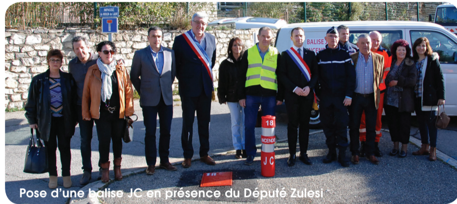
Pose d'une balise JC en présence du Député Zulesi

La première de trois nouvelles balises de type JC est venue équiper la commune, impasse Moulin de Laure, les deux autres se trouveront rue E. Signoret et chemin des Ecoliers. Cela porte leur nombre à 50 sur le territoire des bouches-du-Rhône. Elles viennent identifier les emplacements des bornes à incendie enterrées.