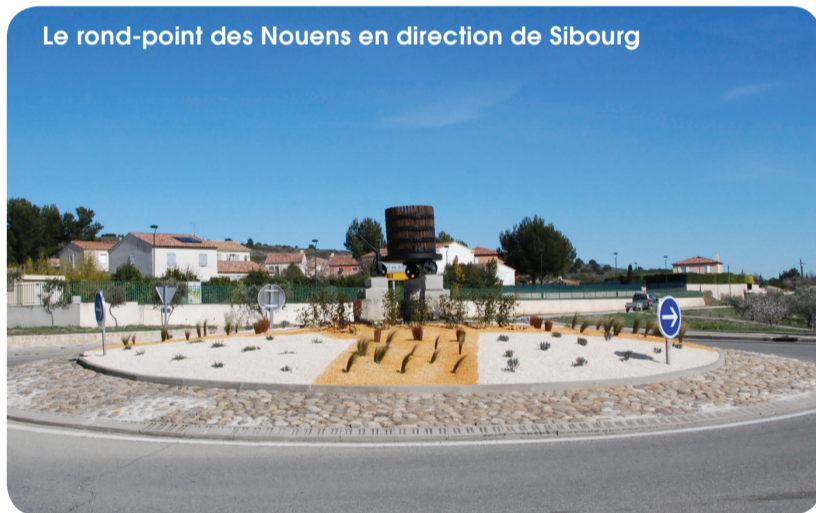
Le rond-point des Nouens en direction de Sibourg

Un apport de nouvelles plantes, essentiellement des essences de la région, lui offre un décor en parallèle à celui des Portes de Lançon sur la RD 113 ; en son centre, le pressoir a été débarrassé des mauvaises herbes et eu droit à une propreté pour sa protection.