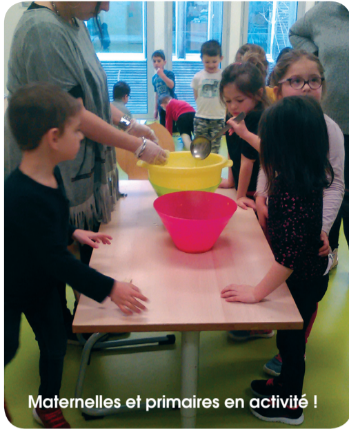
Maternelles et primaires en activité !

Un autre groupe a été reçu à la maison de