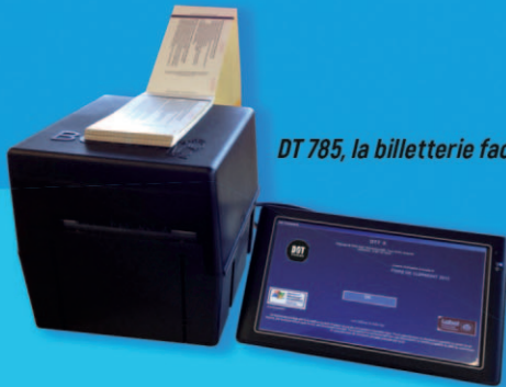
DT 785, la billetterie facile

Conception Fabrication Thermique Animés Antifraude