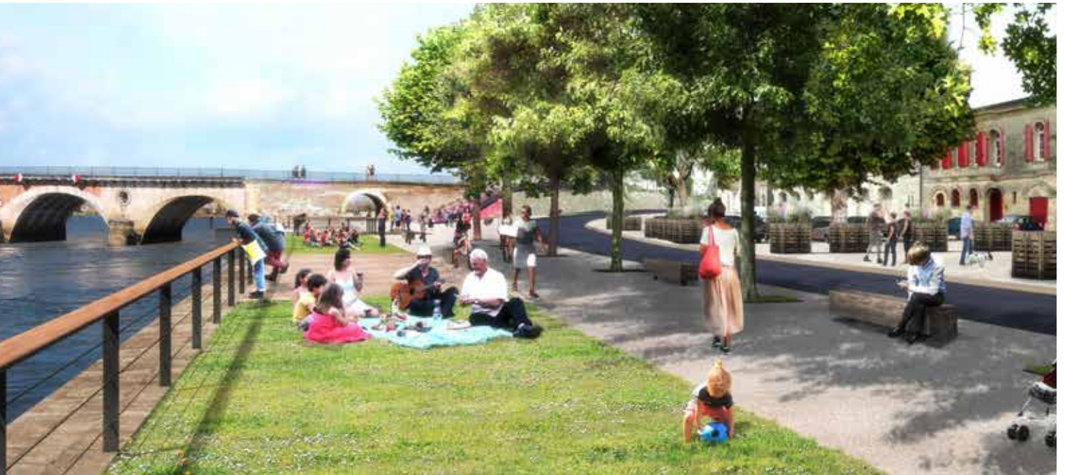
Des quais et berges à vivre