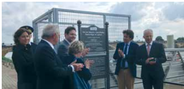
Inauguration du Ponton «Roger de Leyburn»

Depuis 2011, la ville renoue avec son histoire portuaire grâce au développement du tourisme fluvial et c'est tout naturellement que le Conseil Municipal a choisi par une délibération en date du 18 mai 2015 de dénommer le ponton... «Roger de Leyburn».