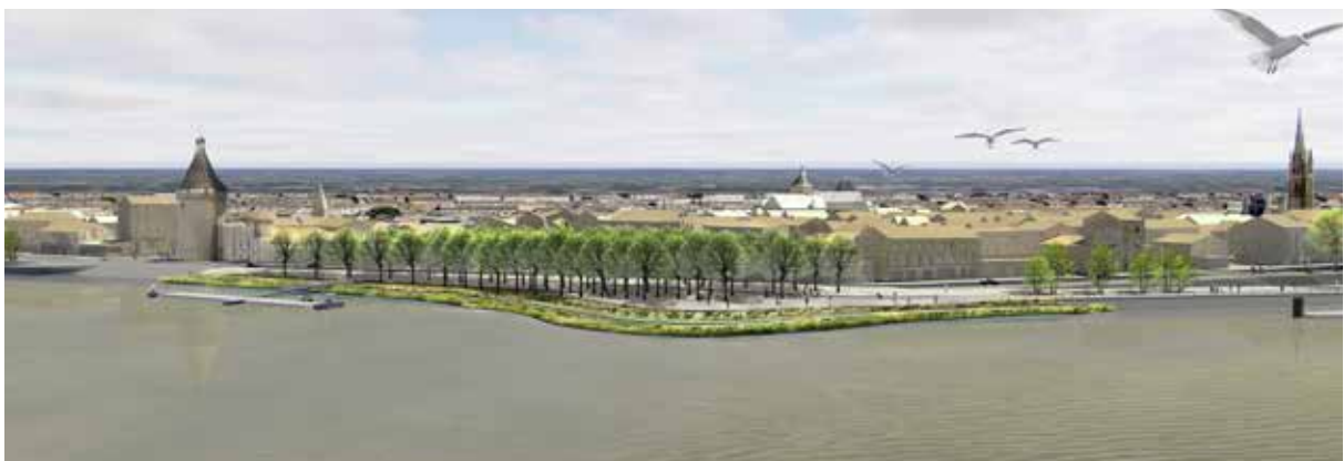
} Rendre les quais et les berges aux Libournais

Oui, cette reconquête de Libourne implique des contraintes, mais c'est à ce prix que nous inscrirons notre ville au cœur de la future grande Région.