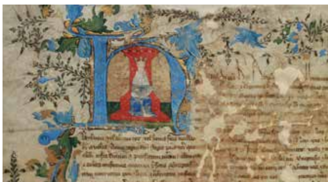
Un des derniers documents de la période anglaise de Libourne avant que la ville ne soit reconquise lors de la Bataille de Castillon.

Depuis la seconde moitié du Moyen Âge, le nom de Roger de Leyburn ou Leybourne fait écho à l'histoire de notre bastide. Le rattachement de l'Aquitaine à la couronne d'Angleterre par le mariage d'Aliénor avec Henri Plantagenêt en 1152 favorise la création et l'expansion du territoire anglais à travers l'édification de ces nombreuses «villes-neuves».