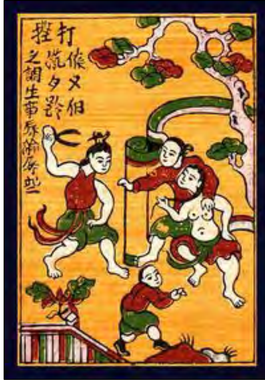
Dessin populaire vietnamien (tranh Đông Hồ), intitulé « Jalousie », représentant un épisode de L'Histoire de Kiều .

Nguyễn Du (1765-1820) est un des plus grands poètes vietnamiens. En 1965, Nguyễn Du a été consacré par l'UNESCO comme personnalité de la culture mondiale. Son chef d'œuvre, Truyện Kiều (en français, l'Histoire de Kiều ) est considéré comme le summum de la littérature vietnamienne par sa perfection linguistique, poétique et philosophique. Cette œuvre est très populaire au Vietnam. Depuis sa parution jusqu'à nos jours, elle a fait l'objet de nombreuses études interdisciplinaires. Elle a également été adaptée pour différents types de spectacle : la musique, le théâtre traditionnel et le cinéma. Elle a été traduite en plus de 30 langues (dont dix versions différentes en langue française).