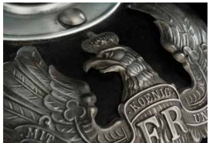
Casque à pointe d'infanterie prussienne (détail)

Bien que centrée sur la Bataille de Mons, cette exposition développe également des thématiques plus larges comme l'importance des croyances et de la spiritualité en temps de guerre, ou encore la résistance civile durant ce conflit.