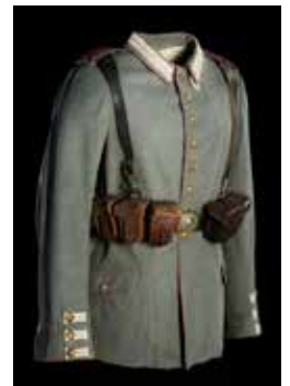
Uniforme de fantassin allemand

L'exposition aborde ce fait historique sous un angle intuitif et réflexif. Les objets de la collection d'histoire militaire de la Ville de Mons sont au cœur du propos. Ces pièces historiques uniques vous permettront de tirer vos propres réflexions ou questionnements, en les confrontant ensuite à la « vérité historique ».