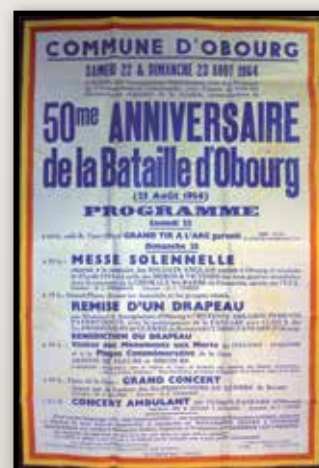
Affiche des Commémorations de la bataille d'Obourg, 23 août 1964