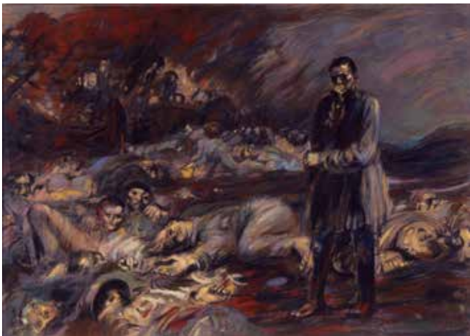
Henry de Groux, Le Chamier (Courrières) , 1906. Pastel sur papier, Collection de la Province de Hainaut Dépôt au B.P.S.22 – Charleroi

La Belle Epoque, une période marquée par des progrès sociaux, techniques, économiques et politiques fulgurants. Elle prendra cependant fin de façon violente le 4 août 1914. L'exposition « Signes des Temps » tente de mieux cerner un état d'agitation généralisé qui se manifeste de manière flagrante dans les arts d'avant-guerre.