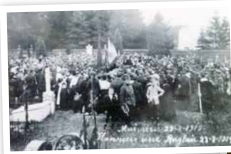
Commemoration de la bataille de Mons, Maisières, 23 août 1919, © Yves Bourdon

Dès la signature de l'armistice, les hommes eurent besoin rapidement de se souvenir, de se rappeler de leurs frères d'armes tombés au combat durant ces quatre années de guerre. Aussi, tous les villages et villes de Belgique voient fleurir des monuments commémoratifs, qui devinrent des lieux de la mémoire collective.