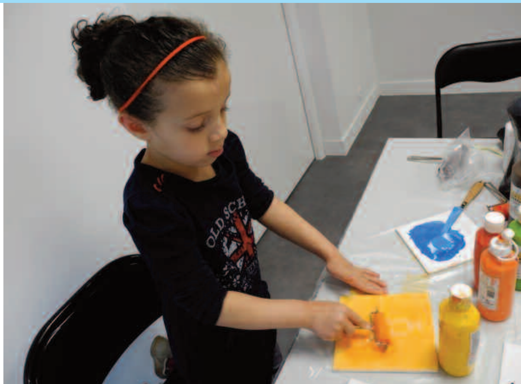
Équipés de crayons, de rouleaux en mousse, de spatules... enfants et parents se sont lancés dans l'aventure.

« Il a donc fallu écrire, et travailler sur la parole, avant de se lancer dans le dessin et l'illustration. » Équipés de crayons, de rouleaux