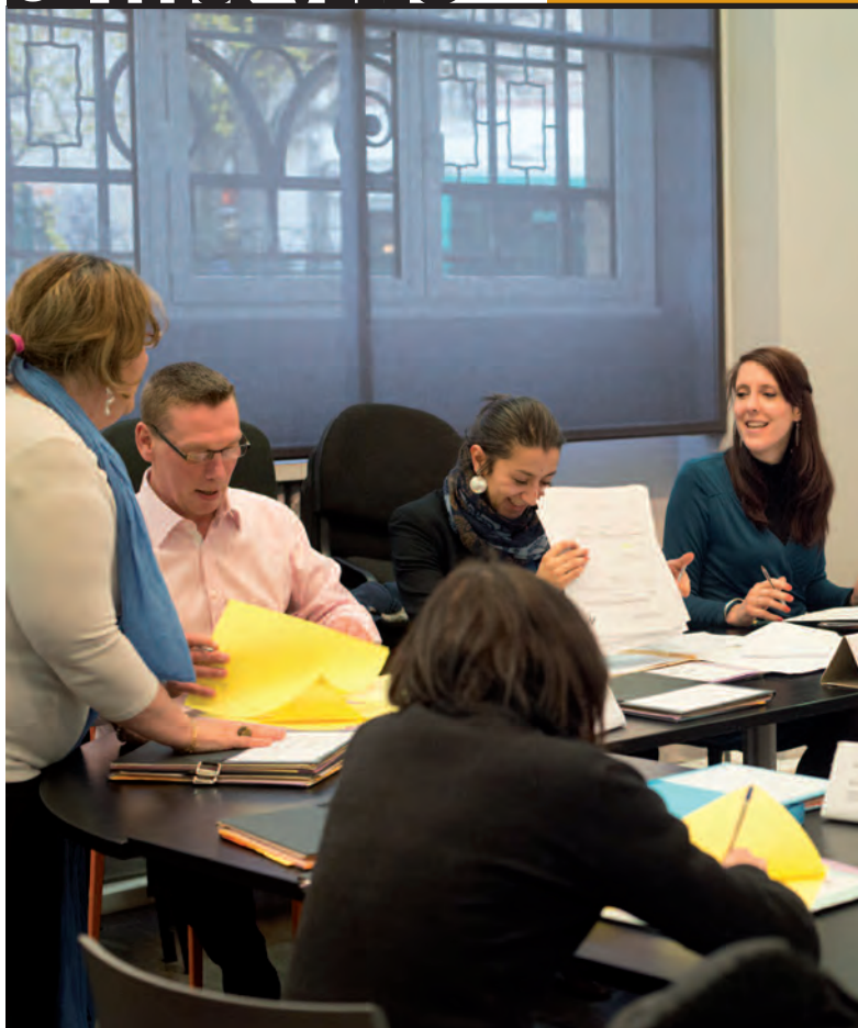
28 février : la commission de révision des listes électorales procède aux derniers arbitrages.