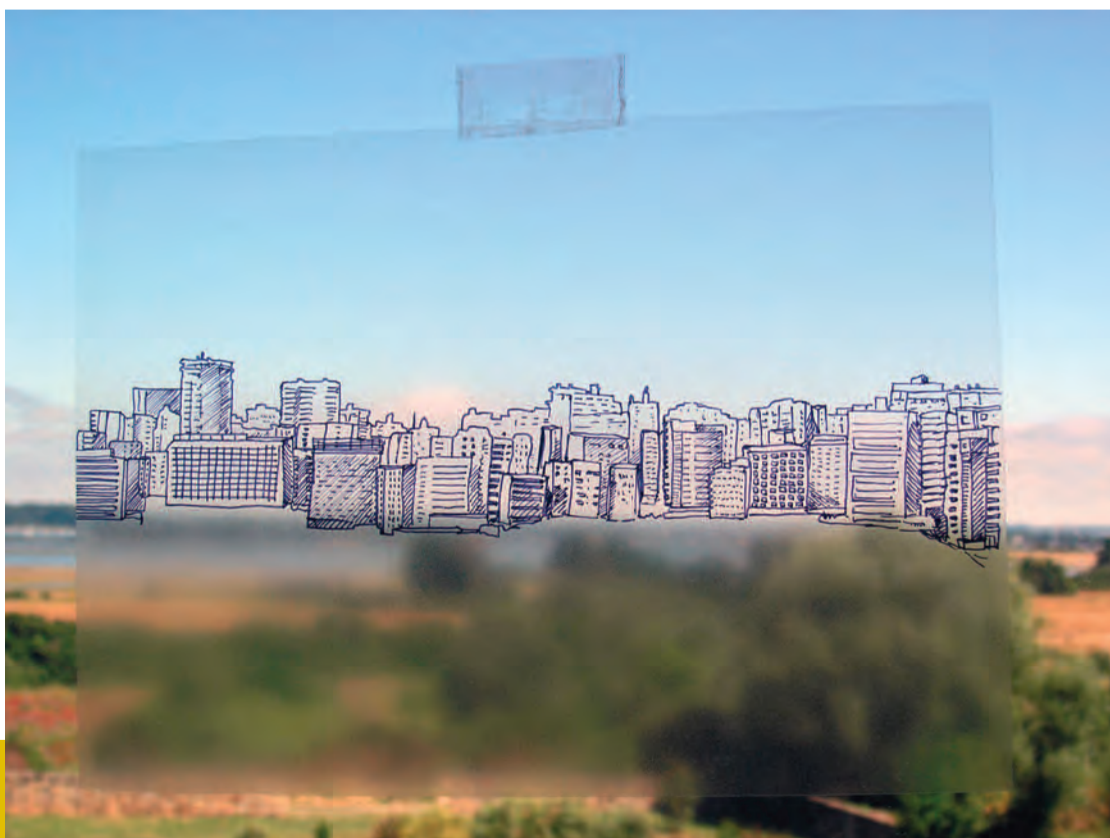
Dessin du peintre et dessinateur montreuillois Yves Belorgey.

✕ SAVOIR PLUS : Territoires/Commun(e)s du 7 mars au 24 mai, Centre d'art contemporain Le 116, 116, rue de Paris. Ouverture du mercredi au samedi, de 14 heures à 19 heures. Entrée gratuite. Visites de groupes sur réservation : contact116@montreuil.fr www.le116-montreuil.fr