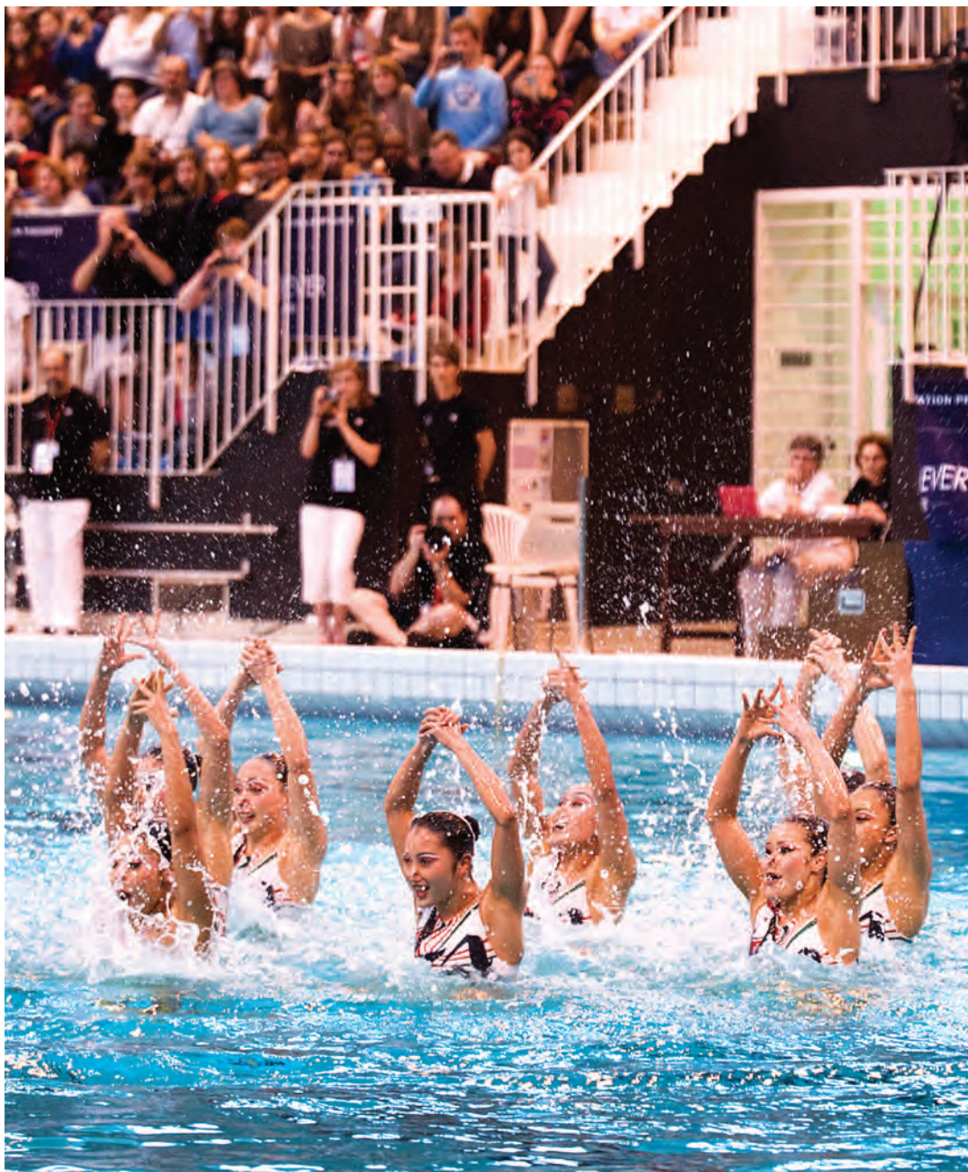
Pour la première fois, l'Open s'achèvera sur une note festive, avec un gala le dimanche après-midi.