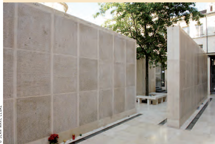
Le Mur des noms : 76 000 juifs déportés, 2 500 survivants.

Du 11 avril au 5 octobre 2014, le Mémorial de la Shoah accueillera une exposition intitulée « Rwanda, 1994 : le génocide des Tutsis ». Un génocide qui a vu l'extermination de plus de 800 000 personnes d'une même ethnie en quelques mois. Au programme également, de nombreux colloques avec des participants de toutes nationalités, débats et projections documentaires. Inauguré en 2005 par Jacques Chirac à l'occasion du 60 e anniversaire de la libération du camp d'Auschwitz le 27 janvier 1945, le Mémorial de la Shoah est devenu le lieu de référence en Europe sur l'histoire du génocide des Juifs. Outre l'exposition permanente sur l'histoire de cette catastrophe et des Juifs en France durant la Seconde Guerre mondiale, un auditorium, une médiathèque, un centre de formation multimédia, une crypte, un centre de documentation, une salle des fichiers juifs établis par l'administration française de Vichy et la préfecture de police de Paris entre 1941 et 1944..., on peut également y trouver de nombreux espaces pédagogiques et de sensibilisation au jeune et moins jeune public. Le visiteur peut s'attarder