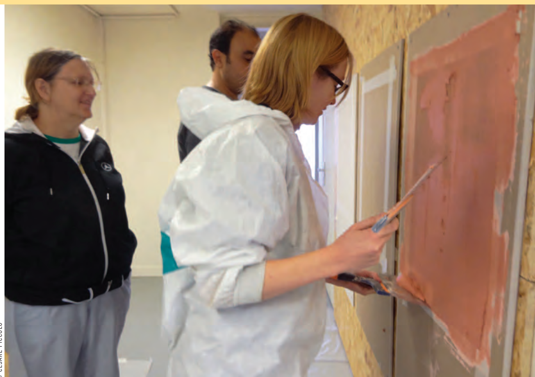
Les formations gratuites dispensées par les Compagnons bâtisseurs facilitent les dynamiques d'entraide et de solidarité.

Gilles Robel : sur rendez-vous au 01 48 70 64 84.