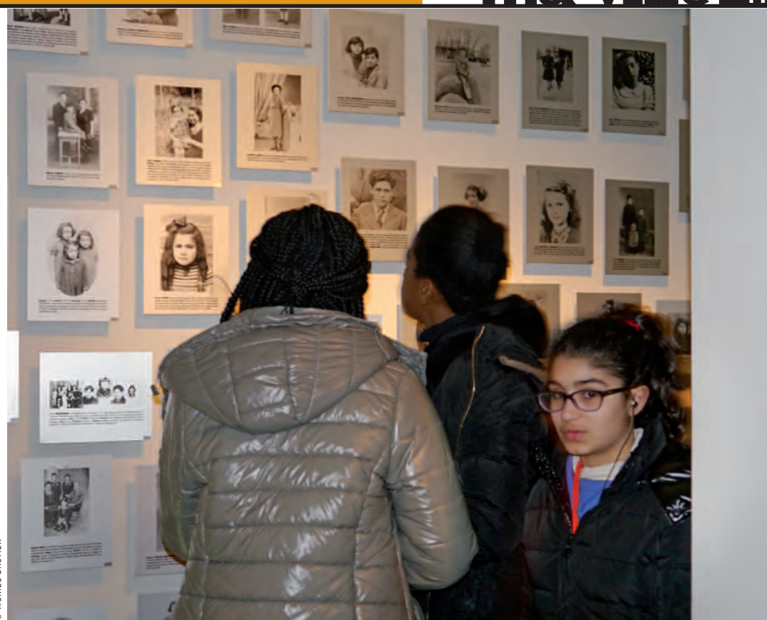
© MURIEL BASTIEN C'étaient des hommes, des femmes, des enfants.