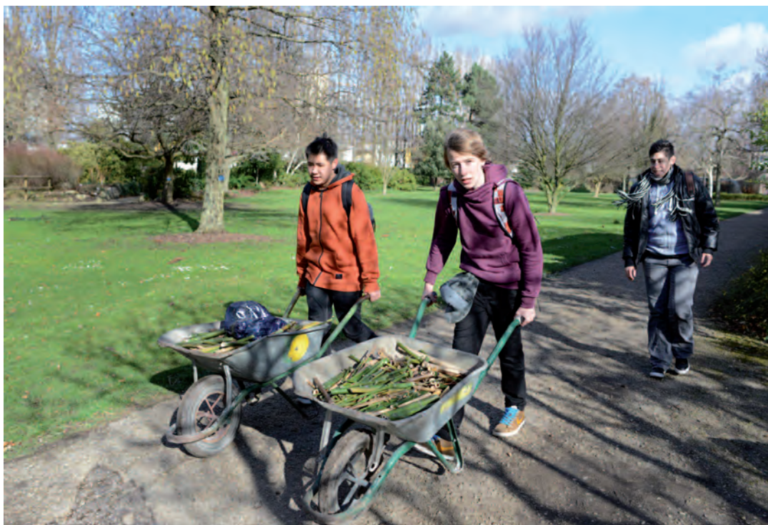
Sur les trois hectares et demi du jardin-école, les élèves du Lycée horticole de Montreuil ont de quoi bûcher et bêcher.