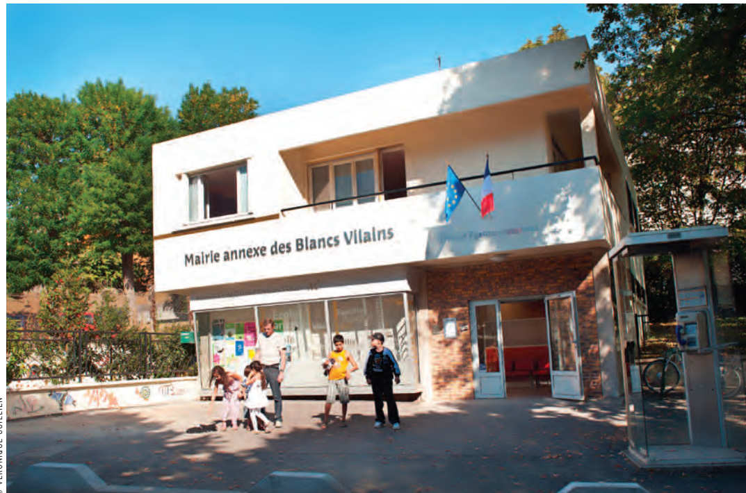
Le service des solidarités et le Clic assurent désormais aussi leurs prestations à la mairie annexe. Alors qu'attendez-vous pour vous simplifier la ville ?

A u sein de ce nouveau guichet de proximité, le service des solidarités instruit depuis le 3 mars certaines prestations sociales comme l'aide médicale d'état (AME), la compensation du handicap (dossier MDPH pour les moins de 60 ans), le forfait améthyste (pour les moins de 60 ans), les aides à l'énergie : le Fonds solidarité énergie (FSE) et le dispositif Aide eau solidaire de Véolia Eau. Ces prestations sont soumises à des critères. Ils nécessitent donc de fournir des pièces justificatives pour constituer le dossier : les informations peuvent être obtenues à la mairie annexe ou bien au service des solidarités, centre administratif Opale A (rez-de-chaussée). Une fois les documents réunis, le demandeur peut se présenter à la mairie annexe afin de rencontrer un référent social du service des Solidarités qui le recevra sans rendez-vous pour vérifier les justificatifs, la recevabilité de la demande et instruire la demande. Attention, la réception pour l'instruction s'arrête une demi-heure