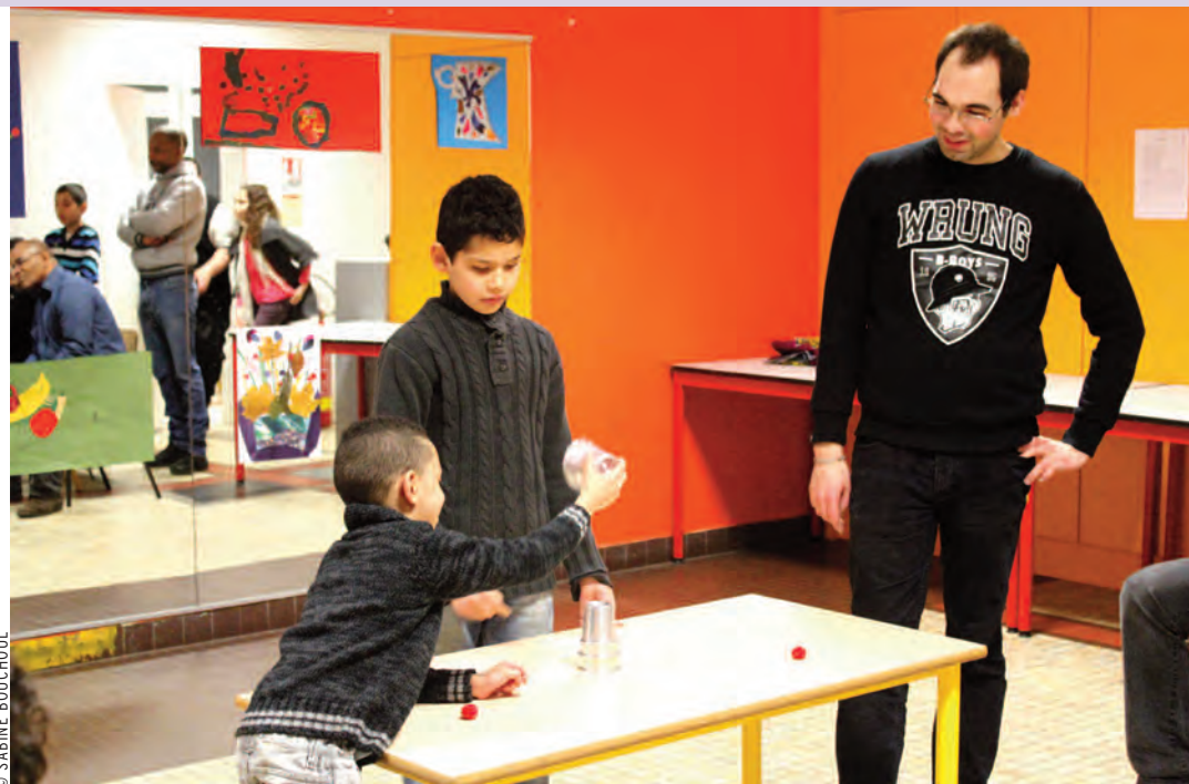
Les enfants montrent les tours de magie qu'ils ont appris au cours de la semaine.