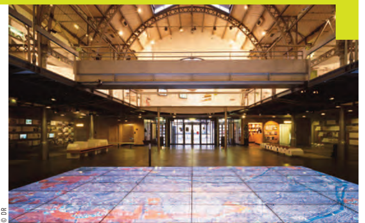
8 000 m 2 d'exposition permanente pour découvrir le visage de la future métropole.

demain sont mises à disposition du grand public, à l'occasion de visites, conférences, et de multiples expositions. Le projet de la future métropole y est bien évidemment représenté, au travers d'une exposition permanente de 800 mètres carrés et d'un millier de documents d'archives ! La maquette numérique de Paris Métropole 2020 y est même dévoilée en exclusivité mondiale ! Idéal pour comprendre depuis l'origine de ce territoire, les