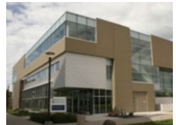
École de médecine du Nord de l'Ontario Lakehead University

Téléphone : +1-705-675-4883 Télécopieur : +1-705-675-4858