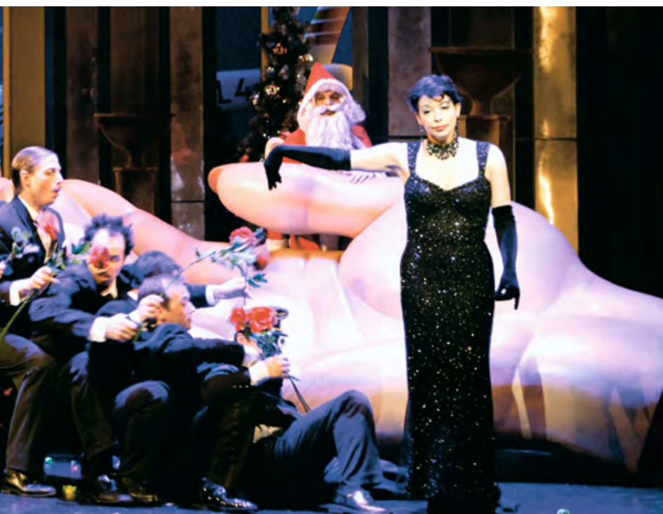
La veuve joyeuse , Opéra de Lausanne, 2006