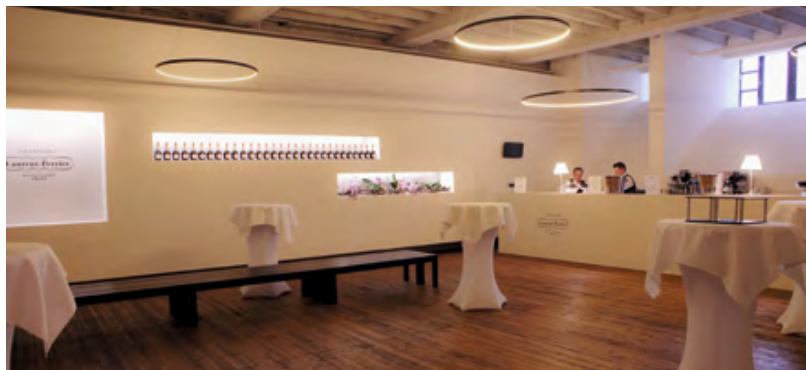
Le bar à champagne « Laurent-Perrier »