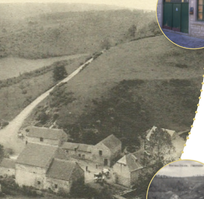
Moulin Hayettes. — Falaën.