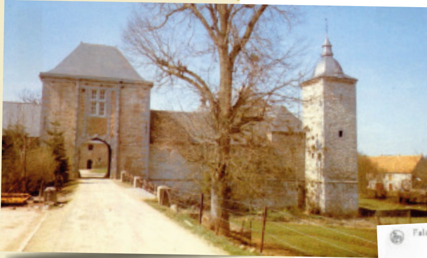
1 Le Château-ferme de Falaën