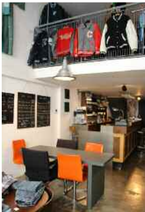
Le fil rouge

Faire son shopping en buvant en verre ou un café ? Un concept qui se répand peu à peu à Grenoble, à la faveur de certains lieux, boutiques et cafés, dont il fait bon pousser la porte. Voici une sélection de bonnes adresses.