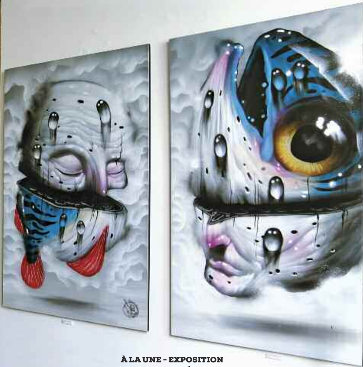
À LA UNE - EXPOSITION "DARWIN THEOREM" À SPACEJUNK