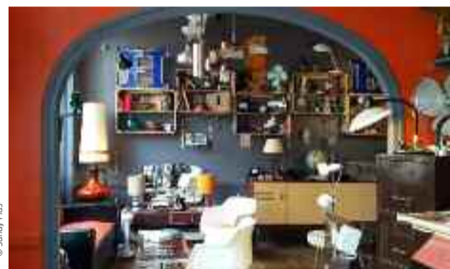
Le café brocante