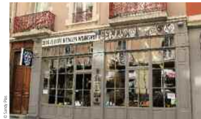
Dead is hype