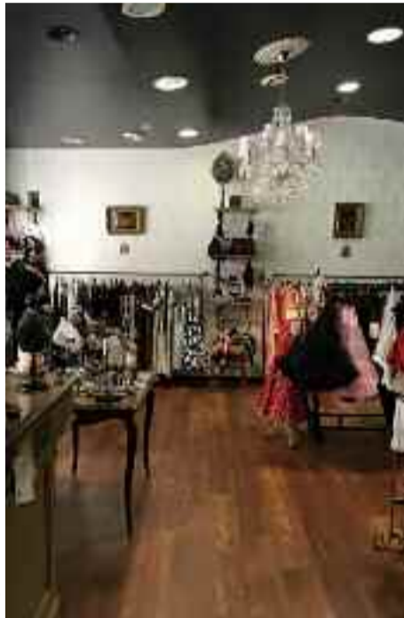
Le Lys noir