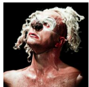
LES PONTEMPEYRESQUES USSON-EN-FOREZ • LOIRE 30 ET 31 AOÛT