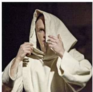
LES BRAVOS DE LA NUIT PÉLUSSIN • LOIRE DU 23 AU 29 AOÛT