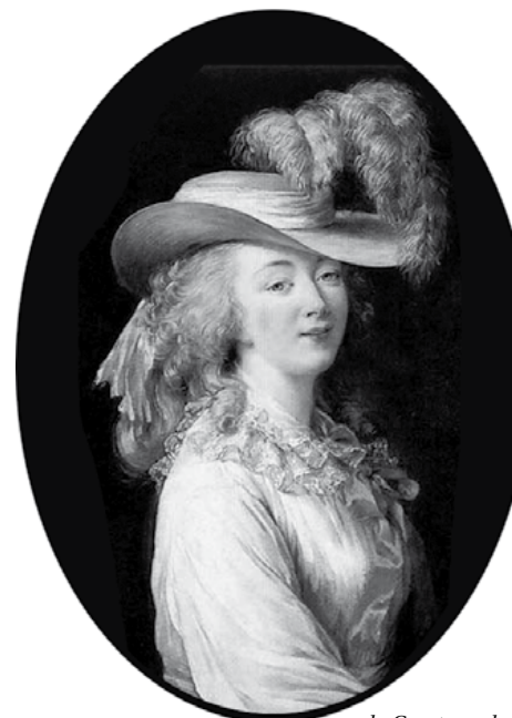
la Comtesse du Barry

Le domaine est ensuite vendu à une des branches de la famille Courtois de Viçose en 1819.