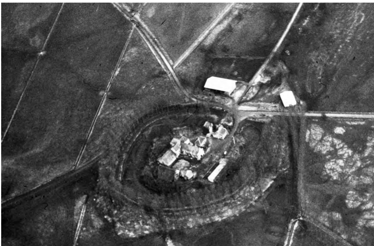
Fourdrain, ancienne abbaye de Saint-Lambert ceint de son fossé médiéval (cliché Michel BOUREUX 1969).