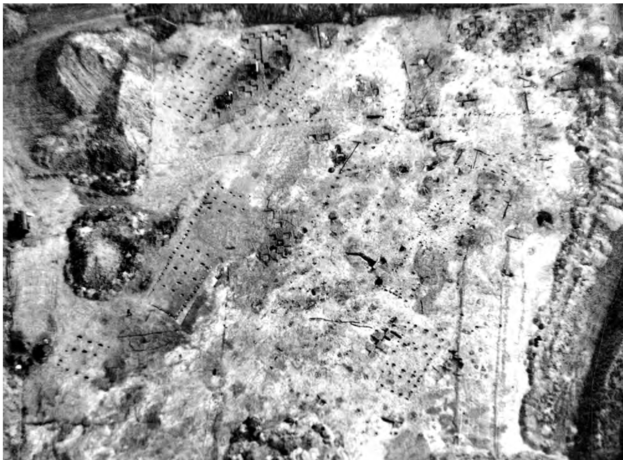
Vue aérienne du premier décapage mécanisé en grande surface. Le village Rubané de Cuiry-lès-Chaudardes "les Fontinettes".