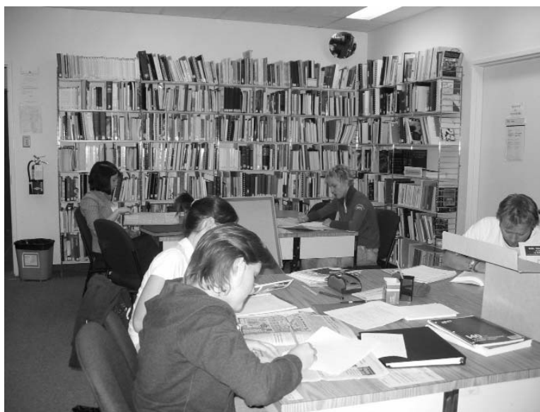
Des étudiants effectuant des recherches à partir de différentes collections de la bibliothèque spécialisée du CRCCF.