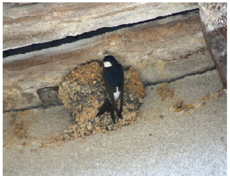
Illustration : Hirondelle de fenêtre venant nourrir ses jeunes au nid.

Ligue pour la Protection des Oiseaux de la Vienne 389 avenue de Nantes • 86000 POITIERS Tél 05 49 88 55 22 • Fax 05 49 30 11 10 vienne@lpo.fr • http://vienne.lpo.fr