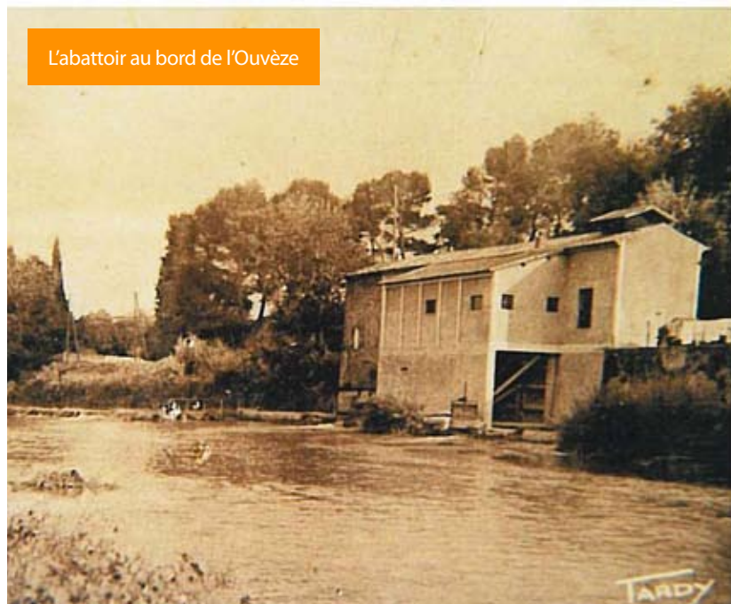
L'abattoir au bord de l'Ouvèze

Le patois des "paysans" qui déteint sur le Français. Pas bien loin, sur le Bouquimard, la radio de "Poète", le bourrelier matelassier qui vous lâche du "Voilà - voilà" à chaque parole, du cuir, du crin, de la laine, tout le métier.