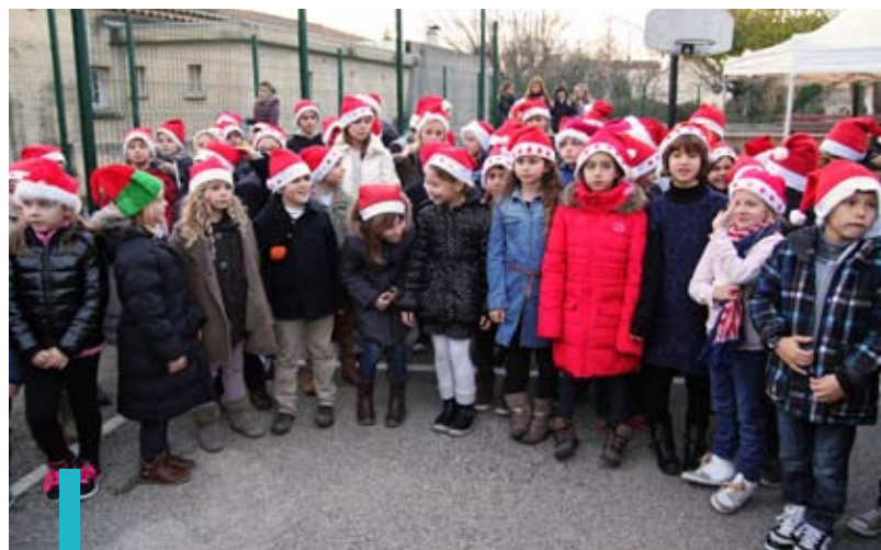
La chorale des enfants lors du Marché de Noël

Le marché de Noël qui s'est déroulé le 19 décembre dernier a rencontré un vif succès. Les parents pouvaient y trouver toutes sortes d'objets confectionnés par leurs enfants, des stands de vente de gâteaux et une buvette. Animation musicale, ambiance festive et chorale ambulante, toutes réunies pour collecter des fonds qui serviront aux prochains projets et sorties de l'école.