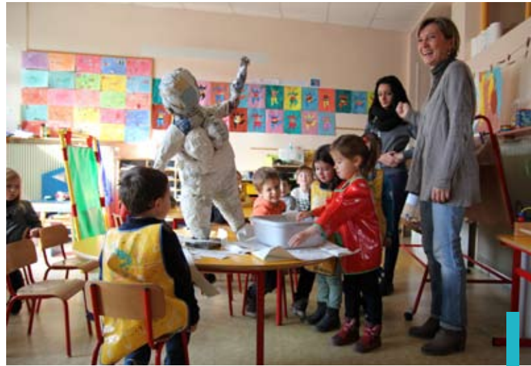
Création d'une «Nana» de l'artiste Niki de Saint Phalle

Il s'agit d'une école catholique sous contrat d'association avec l'État gérée par l'Organisme de Gestion de l'Enseignement Catholique (OGEC). L'OGEC est une association Loi 1901 uniquement composée de bénévoles qui veillent au bon fonctionnement de l'établissement et de ses dépenses. Même en tant qu'école catholique, elle respecte les programmes de l'éducation nationale et remplit ainsi sa mission d'enseignement. Les enseignants sont payés par l'État.