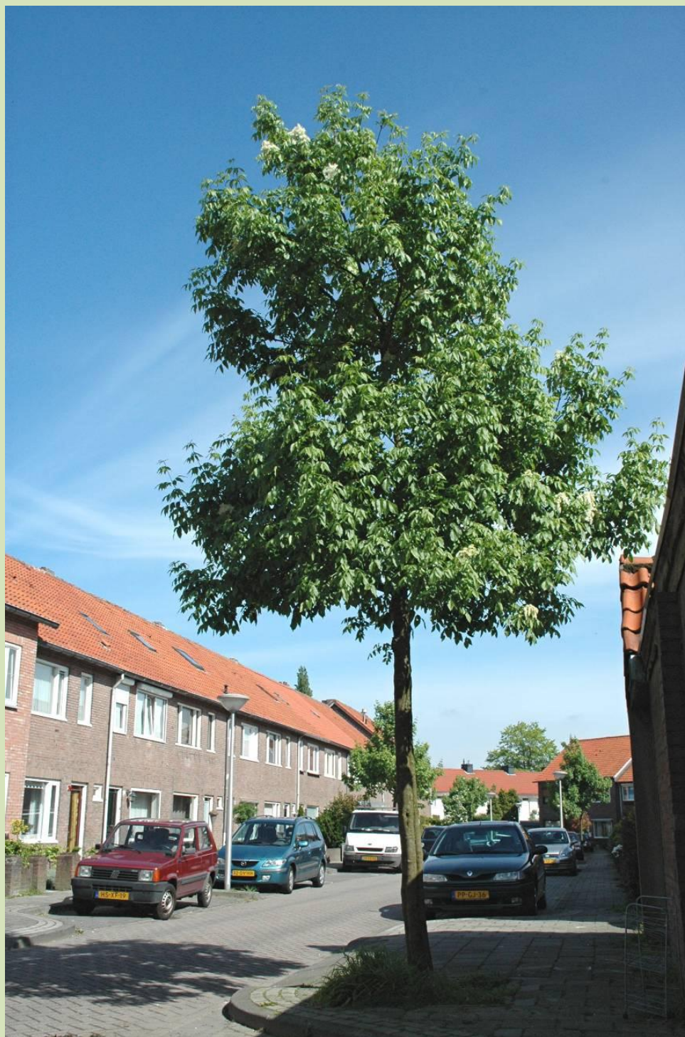
Eindhoven, Steenbergenstraat; voorjaar 2009, 6 jaar na het planten.