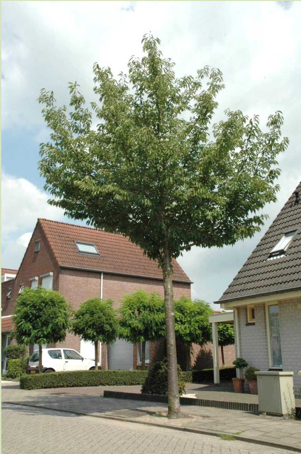
Winssen (Beuningen), De Bongerd; zomer 2007, 7 jaar na het planten.