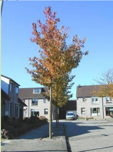
Herfstbeeld jonge boom